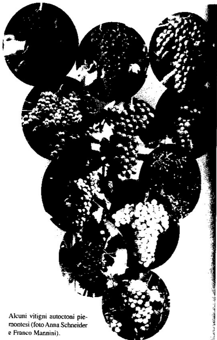
Alcuni vitigni autoctoni piemontesi.

E' questo il caso di una serie di vitigni accomuna-